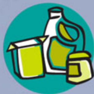
Envases (recogida selectiva: plásticos, bricks, metales).