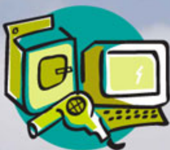
Electrodomésticos (serie blanca y marrón)