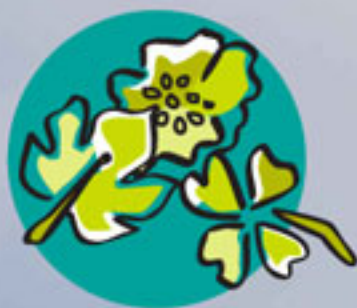
Resto de poda y otros residuos vegetales