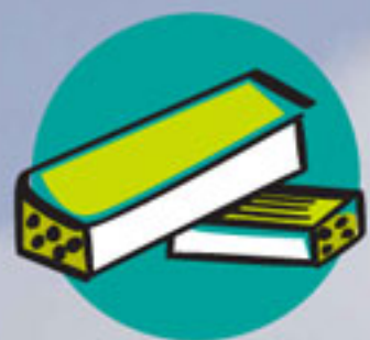
Escombros y restos de obras menores