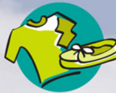
Textiles (ropa y calzado)