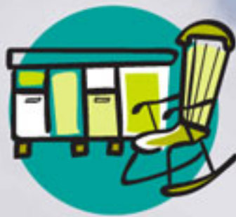
Muebles, colchones, enseres y maderas.