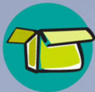
Papel y cartón